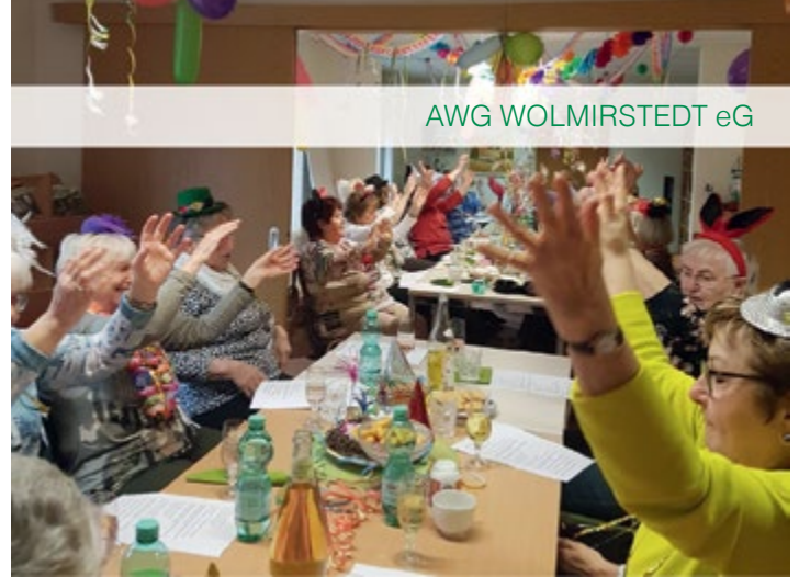
AWG WOLMIRSTEDT eG

... hieß es am 20. Februar 2023 im Mietertreff in der Schwimmbadstraße 3 in Wolmirstedt. 30 Närrinnen und Narren verbrachten einen zauberhaften Nachmittag, bei dem tatsächlich Dinge verschwanden und wieder auftauchten. Bei Pfannkuchen und Kaffee fanden Spiele und Musikeinlagen statt, bei dem alle kräftig mitsangen.